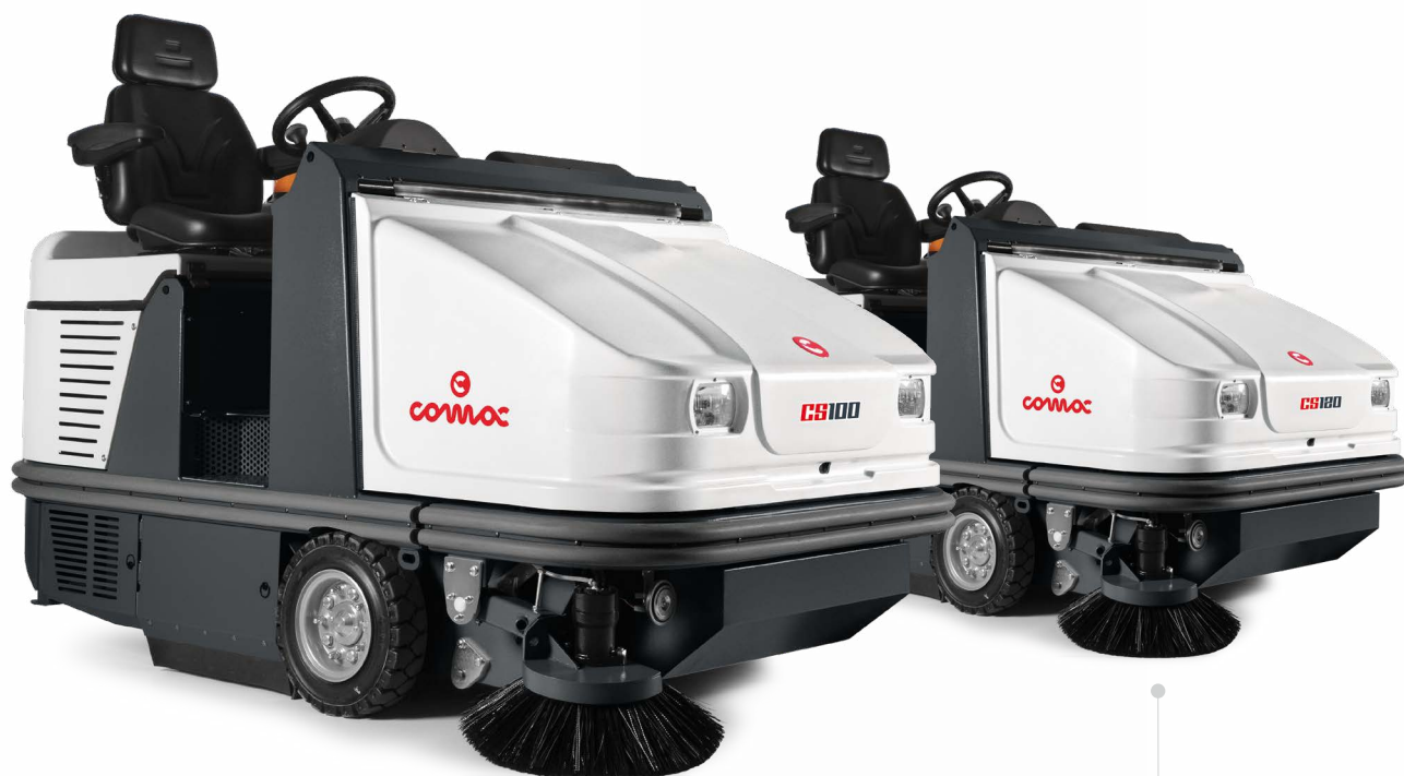
CS100 B/D Versione con una o due spazzole laterali Spazzola centrale: 1000 mm